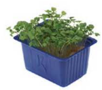
VE177 18 vaschette Rucola cress