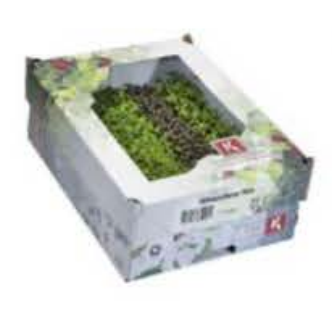
VE098 12 vaschette Whatznew mix single cress