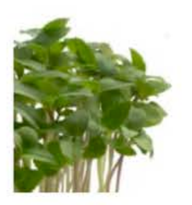
VE166 16 vaschette Basil cress thai