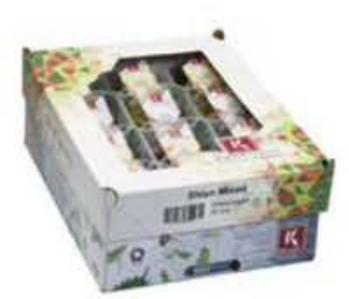
VE070 12 vaschette Shiso mix single cress