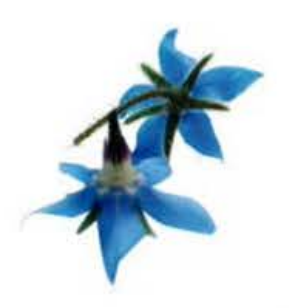
VE046 vaschetta da 30 fiori Borragine