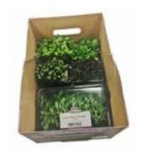
VE172 5 vaschette Assortimento "Autunno"