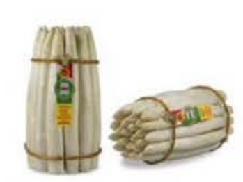
VEOO1 1 kg Asparago bianco di Bassano del Grappa DOP (disponibilità mar-mag)