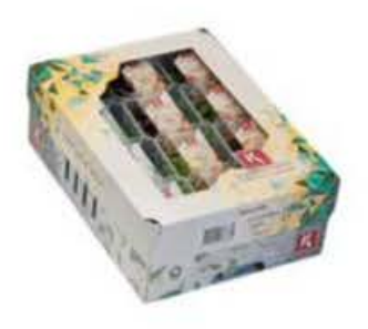
VE075 12 vaschette Sakura mix single cress