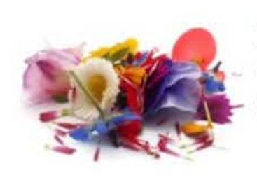
VE036 4 tipologie di fiore 8 vaschette Assortimento stagionale fiori eduli