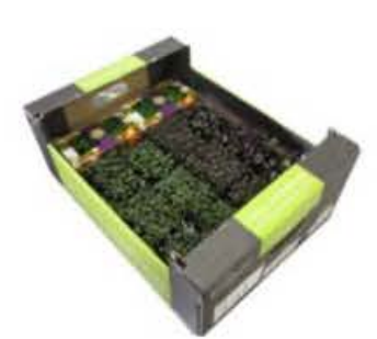
VEI54 14 vaschette Assortimento "Christmas Tasty"