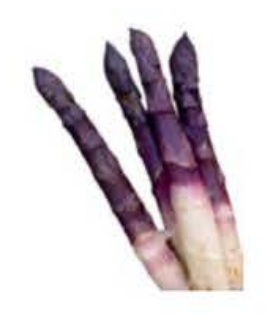
VEOO4 1 kg Asparago violetto di Albenga Presidio Slow Food (disponibilità apr-giu)