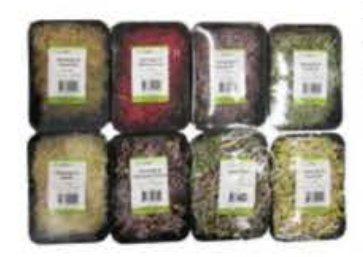
VEO40 8 vaschette Misto di germogli