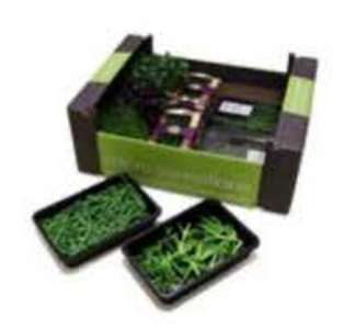
VE162 10 vaschette Assortimento "Primavera"