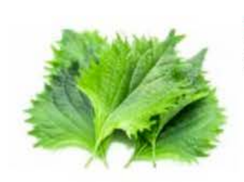
VE228 12 vaschette Shiso verde foglie