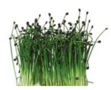
VE126 18 vaschette Rock chives