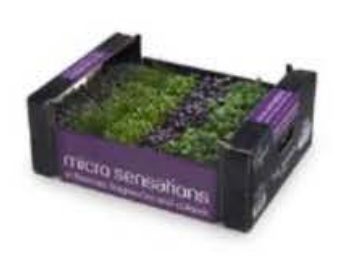
VE194 18 vaschette Taste sensations cress mix