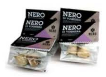
EA034 100 g - 4/5 bulbi Nero di Voghiera bulbi di aglio fermentato