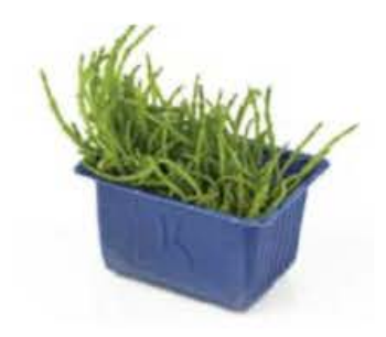
VE079 12 vaschette Salicornia single cress (disponibilità giu-sett)