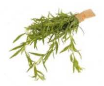
EA018 140 g Santoreggia