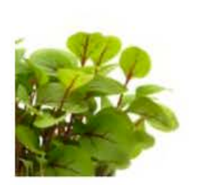
VE157 4 conf. da 25 g cad. Micro red vein sorrel