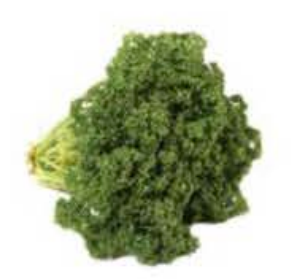
EA014 100 g Prezzemolo riccio