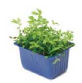
VE189 12 vaschette Motti cress