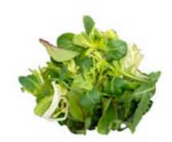
VE067 200 g Soncino mix