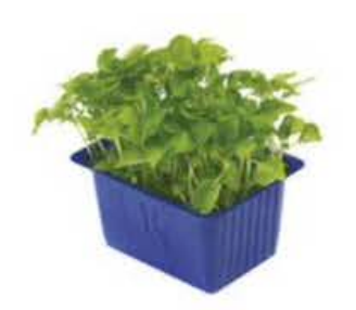
VE077 12 vaschette Sechuan single cress