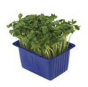
VE076 18 vaschette Daikon cress