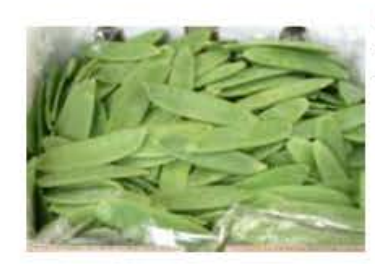
VEO35 2 kg Taccole