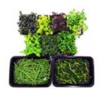
VE130 15 vaschette Assortimento crescioni