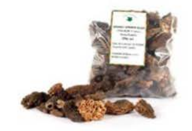
SP016 250 g Spugnole teste disidratate