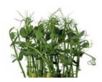
VE074 12 vaschette Affilla cress