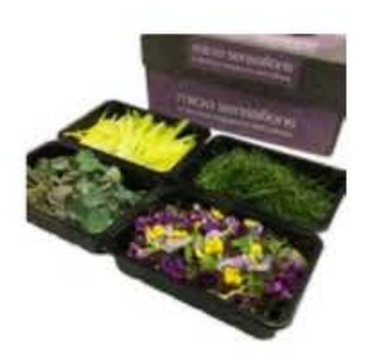
VE199 4 vaschette The possibilities box mix