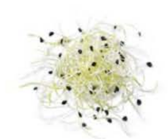
VEI91 50 g - 8 vaschette Porro germogli