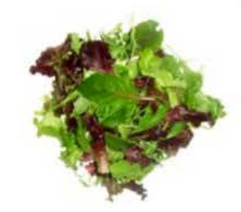
VE061 200 g Insalata di campo mix