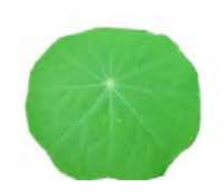
VE220 vaschetta da 15 foglie Foglia di Nasturzio