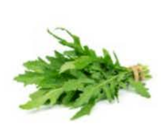
VE025 200 g Rucola