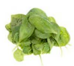
VE023 200 g Spinacio