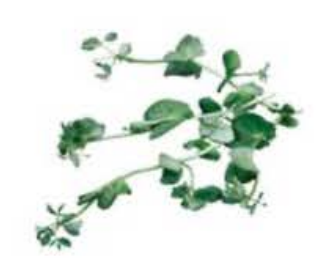
VE143 2 vassoi da 100 g Salad pea