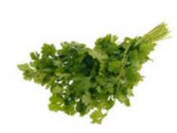
EA007 160 g Coriandolo