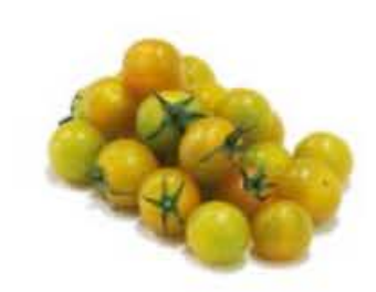
VE226 250 g Pomodorino Cherry giallo