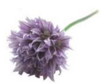
VEO43 8 vaschette da 10 fiori Fiori di cipollina (disponibilità mar-giu)