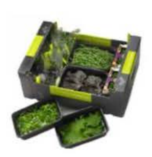
VE160 5 vaschette Assortimento "Sapore di mare"