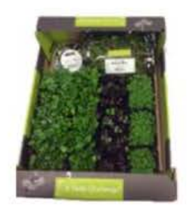
VE185 14 vaschette Assortimento "Halloween"