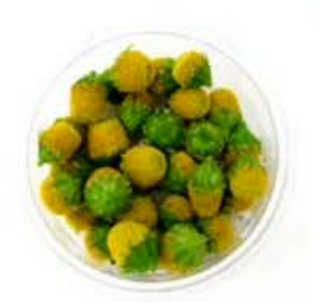
VE083 vaschetta da 30 fiori Sechuan Buttons (Fiore Elettrico)