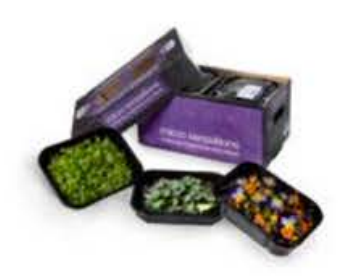
VE145 conf. da 5 vaschette Mix Estivo Fiori e Crescioni (disponibilità giu-set)