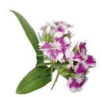
VE044 vaschetta da 30 fiori Garofano dei poeti